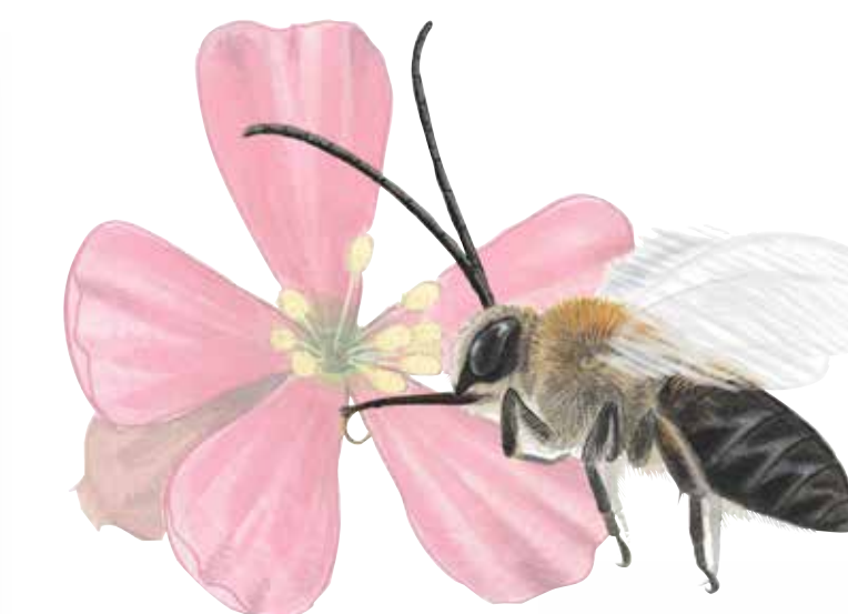
Långhornsbi Eucera longicornis

...runt slätterängen är främst till för att hålla vildsvinen borta.