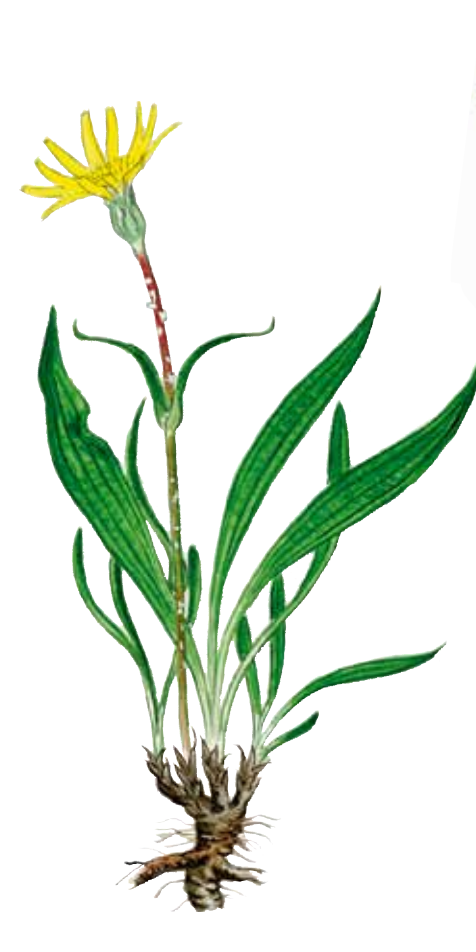
Svinrot Scorzonera humilis vars blad har vit mjölksaft, vilket skiljer dem från svartkämparnas blad som de liknar.