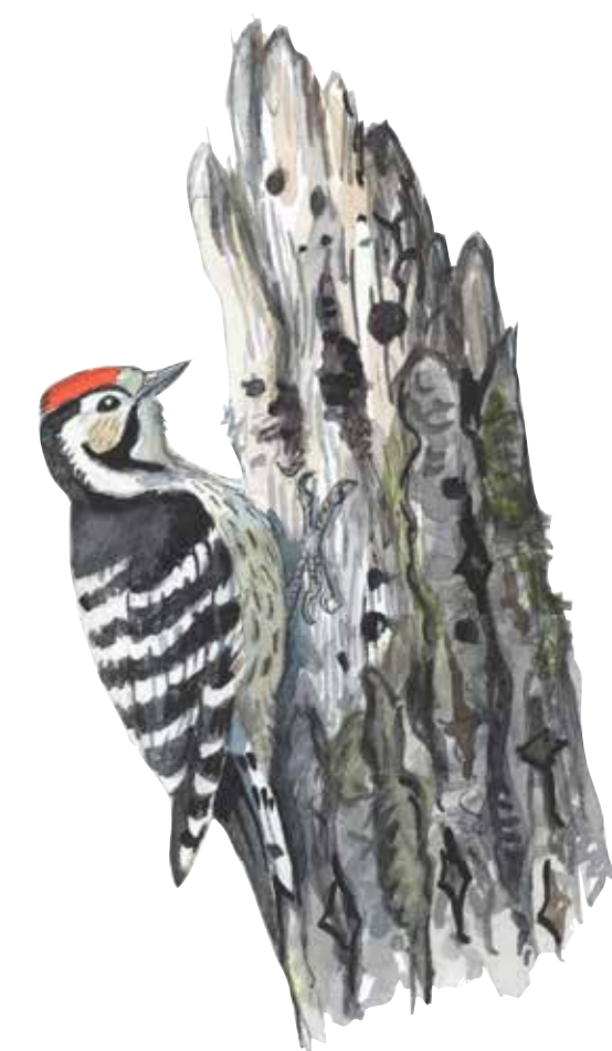
Mindre hackspett Dendrocopos minor – Europas minsta hackspett, inte större än en grönfink.

3. Ängen fagas, det vill säga städas fri från löv och grenar, för att gynna gräs och örter.