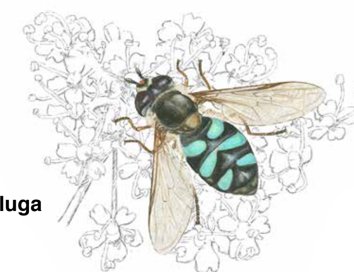
Grön vinkelblomfluga Didea alneti

Långhornsbiet har ovanligt långa antenner som har gett arten dess namn.